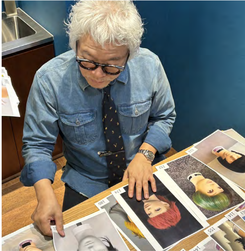
入賞作品の選出は山下氏のサロン (Double SONS) で実施されました