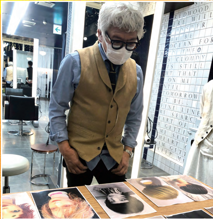
入賞作品の選出は山下氏のサロン (Double SONS) で実施されました